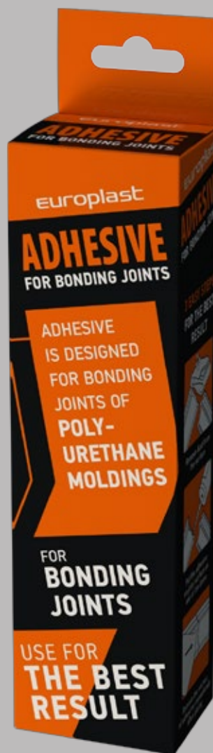
Лепило за свързващи фуги

Въпросната информация важи само и единствено за лепилата от марката Европласт. Ако работите с лепила от други производители, следвайте инструкциите на опаковката.