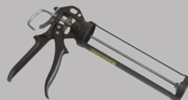
Пистолет за лепило