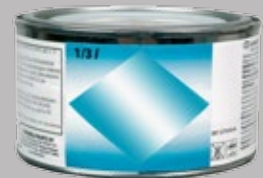
Фин водоразтворим уплътнител